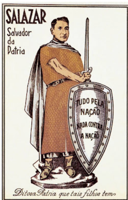
Postal ilustrado de 1935, representando Salazar, como “Salvador da Pátria”.

https://press-files.anu.edu.au/downloads/press/n2129/html/ch03.xhtml